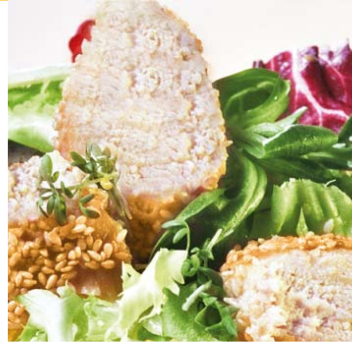
Auch eine ausgewogene, nicht zu fette Ernährung hilft, die Gefäße gesund zu erhalten.