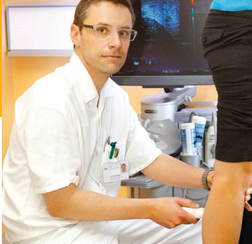
Die Duplex-Sonografie (Gefäßultraschall) gehört zu den Standarduntersuchungen bei der Abklärung von Gefäßerkrankungen.

Moderne Untersuchungsmethoden garantieren den PatientInnen eine zuverlässige Diagnostik.