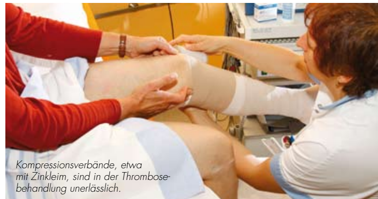
Kompressionsverbände, etwa mit Zinkleim, sind in der Thrombosebehandlung unerlässlich.

Thrombosen müssen unverzüglich erkannt und behandelt werden, um lebensbedrohende Komplikationen wie eine Embolie zu verhindern.