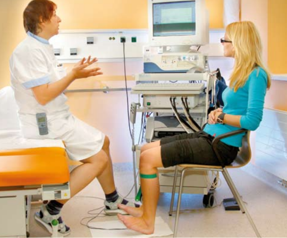
Die Lichtreflexionsrheografie, auch Muskelpumpentest, dient der ersten Abklärung bei Verdacht auf eine chronisch venöse Insuffizienz.