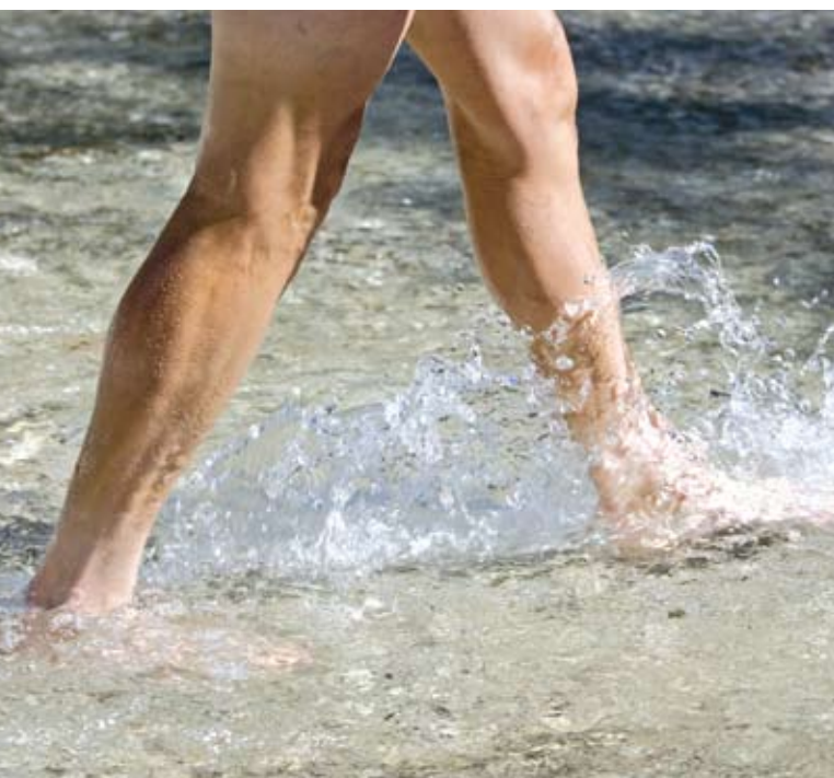
Kneipp'sche Kaltwassergüsse können schlaffen Venenwänden wieder Spannung zurückgeben.

Neben nächtlichen Wadenkrämpfen fühlen sich die Beine bei einer chronisch venösen Insuffizienz oder bei bereits vorhandenen Krampfadern oft müde und schwer an und es tritt ein unangenehmes, dauerhaftes Spannungsgefühl auf – besonders nach langem Sitzen oder Stehen oder bei warmem Wetter. Unbehandelt können sich im weiteren Verlauf Wassereinlagerungen (Ödeme) bilden, die sich besonders im Knöchelbereich zeigen. Fallweise entzünden sich die Varizen auch und es entstehen chronische, schwer heilende Geschwüre – die gefürchteten offenen Beine (lesen Sie hierzu mehr auf Seite 18). Charakteristisch für Venenklappenerkrankungen ist auch, dass die Beschwerden beim Gehen meist besser werden. „Es kann jedoch durchaus vorkommen, dass die Betroffenen jahrelang keinerlei Symptome haben und sie sich lediglich aus kosmetischen